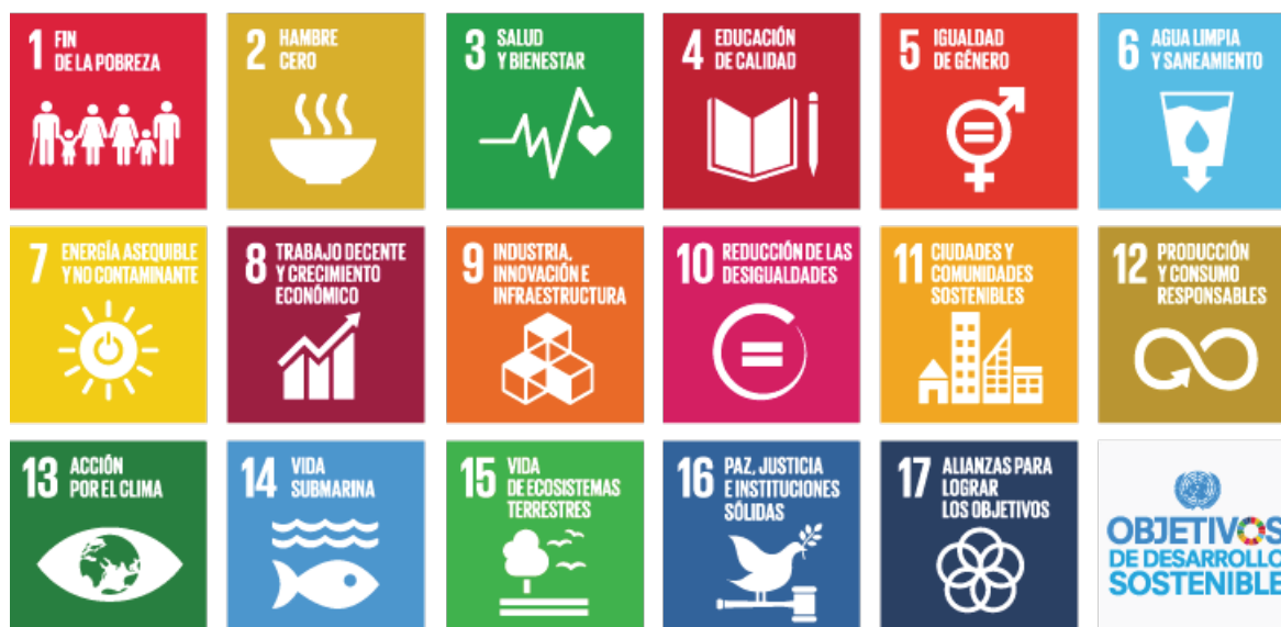
Figura N°1: Objetivos de Desarrollo Sostenible